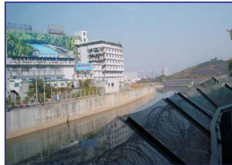
Border between Hong Kong SAR and the Shenzhen SEZ

与中国中央行政结构并行的、旨在建立一定程度的自治组织和自治区域 (特别行政区 (SAR); 经济特区 (SEZ))