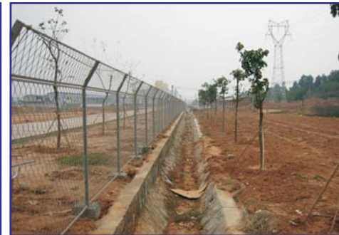
Factory compound surrounded by a fence in Guangzhou