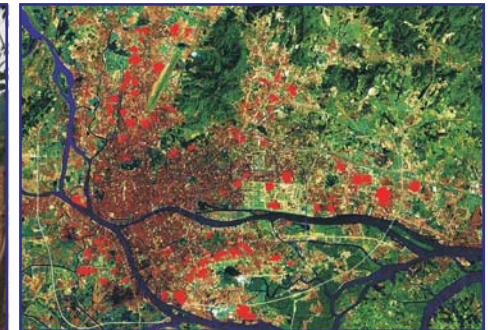
Urban villages (red) in the heart of Guangzhou

包括街区不同社会层面、不同建筑构造的各种住宅群体 (城中村、住宅小区、封闭居住区)