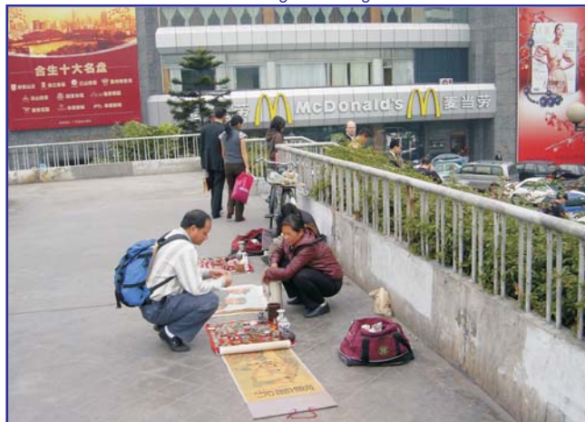
Informal Trader on a Pedestrian Bridge in Guangzhou 2006

边界是指划分空间和群体的界限。我们将从各个国家和地区的不同层面同时观察正式和非正式边界,并把所有这些边界都视为一种社会构建,反映了不断变化的政治、社会经济和文化条件。边界不仅在土地管理和规划上起作用,而且对于居住在该区域内的人民来说也是极具意义的。我们的研究方法将从两个方面出发:“自上而下”和“自下而上”。